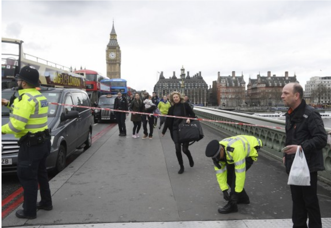
La policia acordonant la zona de l'atac.

assistit el policia apunyalat i ha intentat aturar-li l'hemorràgia. A hores d'ara la principal hipòtesi és que hi havia un sol atacant, tot i que es desconeix si tenia o no suport extern. Els serveis d'emergència han rescatat una dona de les aigües del riu Tàmesi que devia estar al pont quan s'ha produït l'atropellament.