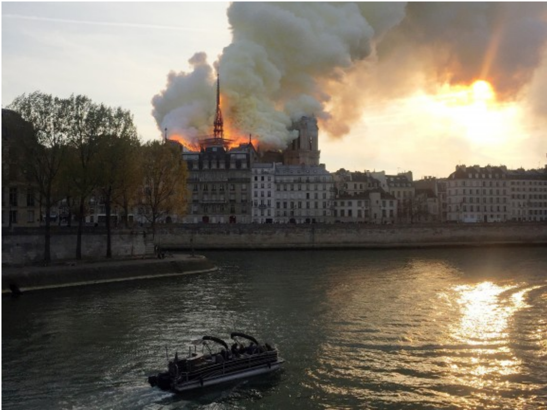
Notre-Dame, devastada