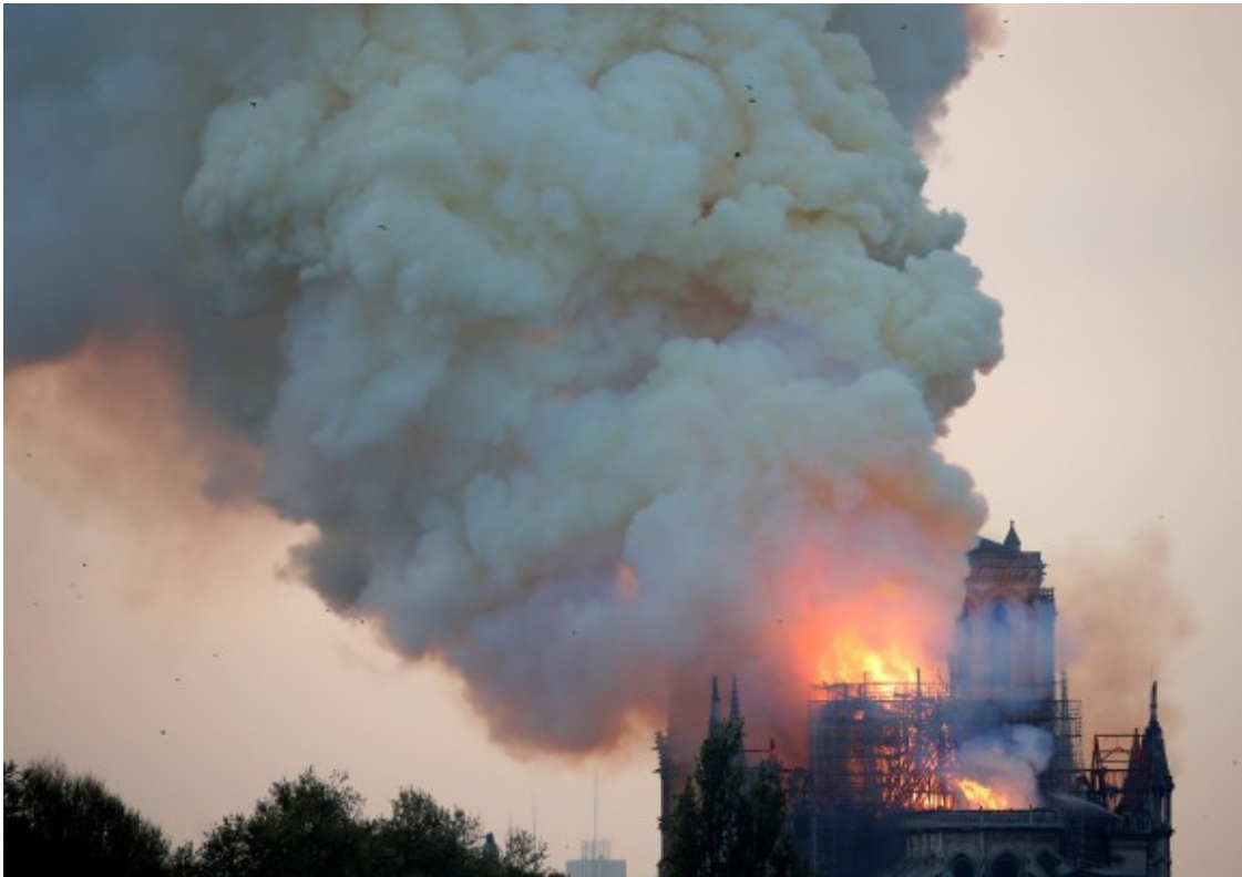
La catedral de Notre-Dame en flames, ja sense l'agulla