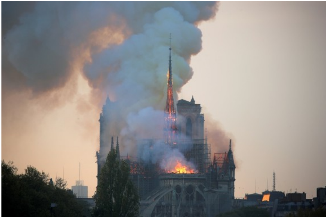
La catedral de Notre-Dame de París en flames